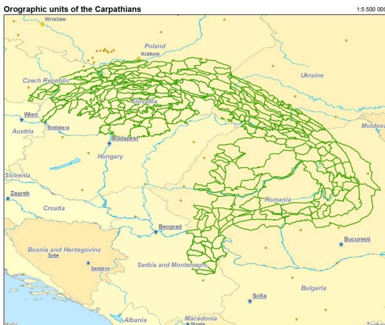
Figure 1. Map of the Carpathian eco-region as used in the CBIS.

The boundaries of the Carpathians as proposed for the purpose of this assessment are shown in Figure 1. This map was used in previous projects for development of the Carpathian Biodiversity Information System (CBIS), this includes borders of 309 orographic units and the organisation of data collection can be compatible with previous Carpathian projects. This can serve as a basis for data gathering and display the species distribution, and is available on www.carpates.org/cbis/orogs.html . The details and GIS layers will be provided by the PP9.